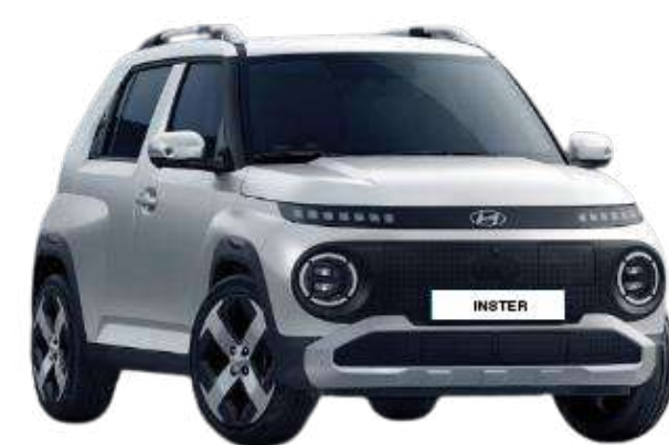
Aero Silver (Matte)*