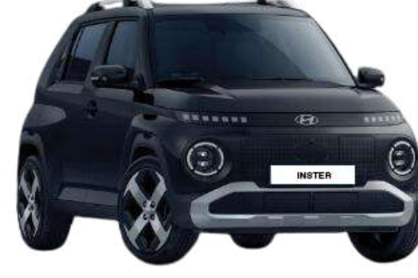
Abyss Black (Pearl)