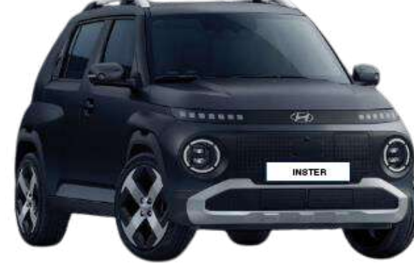
Dusk Blue (Matte)