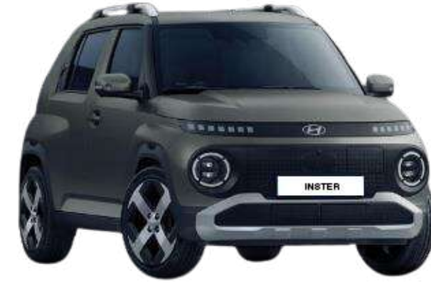
Bijarim Khaki (Matte)