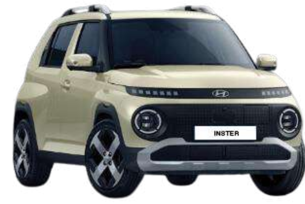
Buttercream Yellow (Pearl)