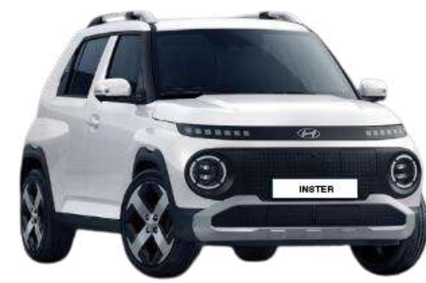
Atlas White (Pearl)*