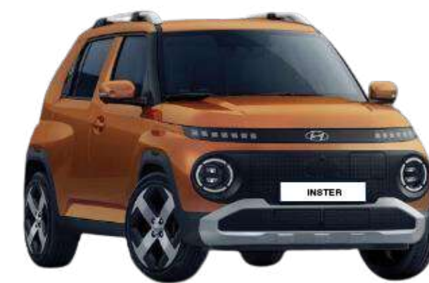
Sienna Orange (Metallic)*