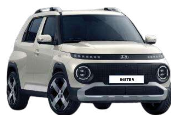
Natural Ivory (Metallic)

Izaberite iz IN-teresantne palete vanjskih boja i stvorite potpuno novi INSTER koji najbolje odgovara vašem osobnom stilu.