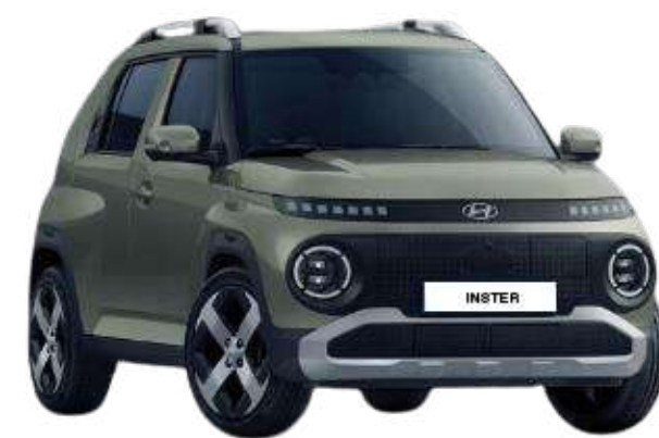
Jungle Khaki (Gloss)*